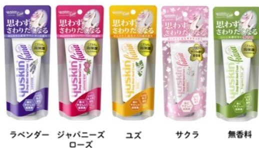
ラベンダー ジャパニーズローズ ユズ サクラ 無香料