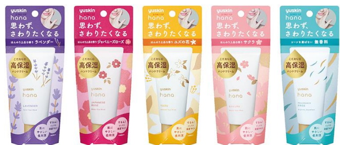
ラベンダー ジャパニーズローズ ユズ サクラ 無香料